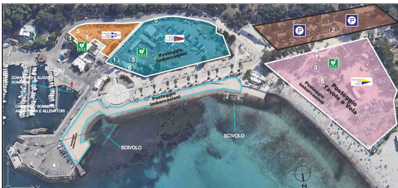
Individuazione dell'area di intervento - Villaggio regate porticciolo di Marina Piccola.

Nella planimetria allegata sono indicate tutte le zone sopraelencate.